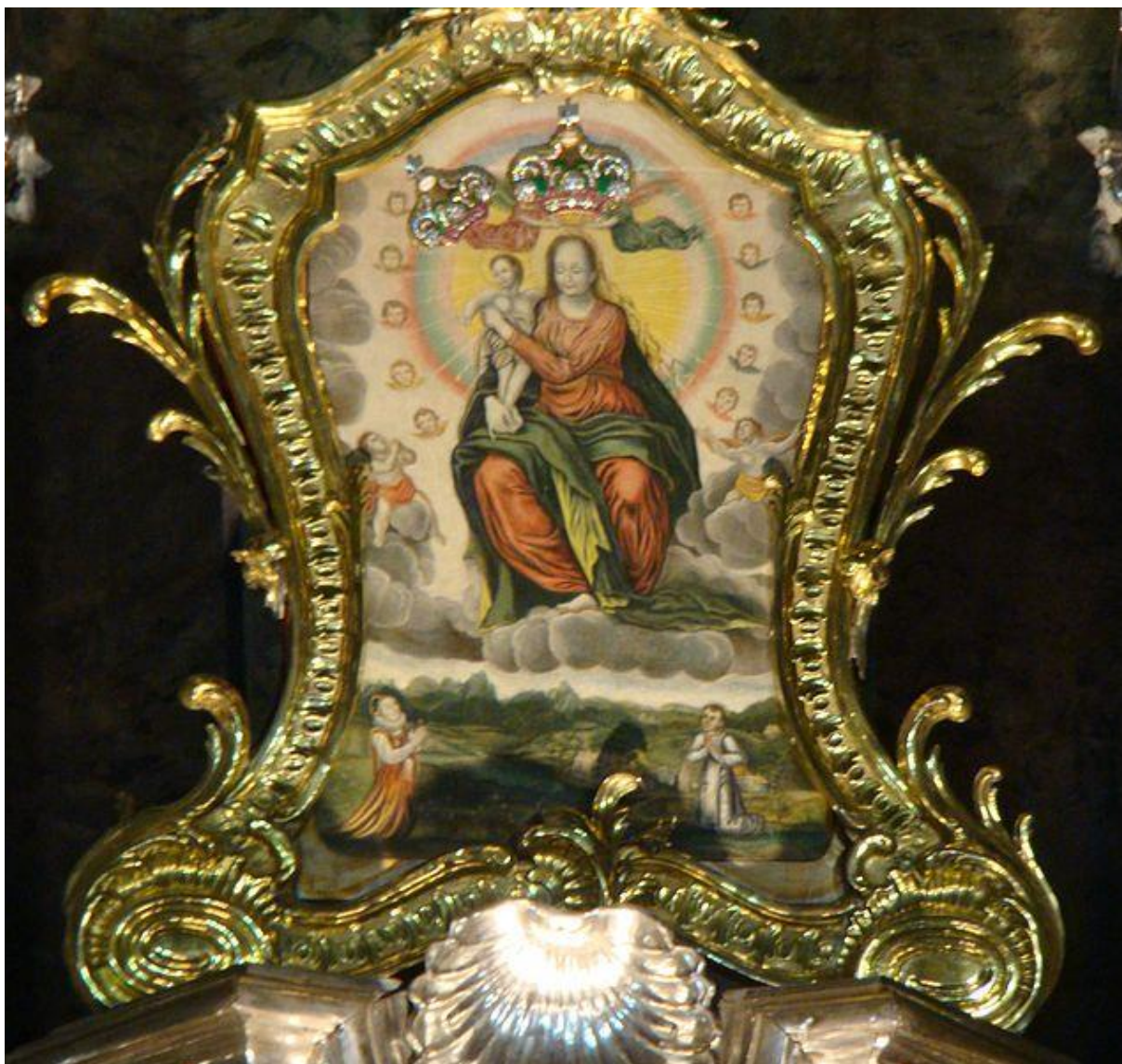
Najświętsza Panna Maryja Łaskawa ze Lwowa

1 kwietnia 1656 roku, król Jan Kazimierz w katedrze we Lwowie otoczony biskupami, senatorami w obecności legata papieskiego złożył swe śluby przed obrazem Matki Bożej Łaskawej i uroczyście ogłosił Maryję Królową Korony Polskiej. Wtedy też po raz pierwszy, podczas publicznego odmawiania litanii loretańskiej przez nuncjusza papieskiego Piotra Vidoniego, padło trzykrotnie powtórzone wezwanie: Królowo Korony Polskiej, módl się za nami. W 1671 roku, król Michał Korybut Wiśniowiecki umieścił godło Polski na cudownym wizerunku Matki Bożej z Rokitna w miejscowości Gołąb w woj. lubelskim.