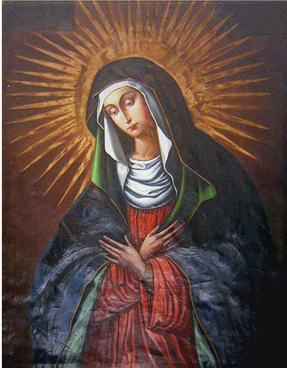
Ostrobramska Matka Boża Miłosierdzia Królowa Korony Polskiej

W 1640 roku cystersi z Bledzewa (koło Międzyrzecza) podarowali cysterkom w Marienstern na Łużycach obraz Matki Bożej z godłem królów polskich na piersi. 27 czerwca 1651 roku, król Jan Kazimierz otrzymał dzień przed wielką zwycięską bitwą pod Beresteczkiem obraz Matki Bożej Łaskawej od nuncjusza papieża Innocentego. W 1655 roku, obrona Jasnej Góry przed Szwedami dokonała się według ówczesnej opinii katolickiej za sprawą Maryi. Odejście Szwedów od Jasnej Góry, o którym król Jan Kazimierz dowiedział się w Krośnie, wpłynęło na nazwanie Matki Bożej Królową Polski.