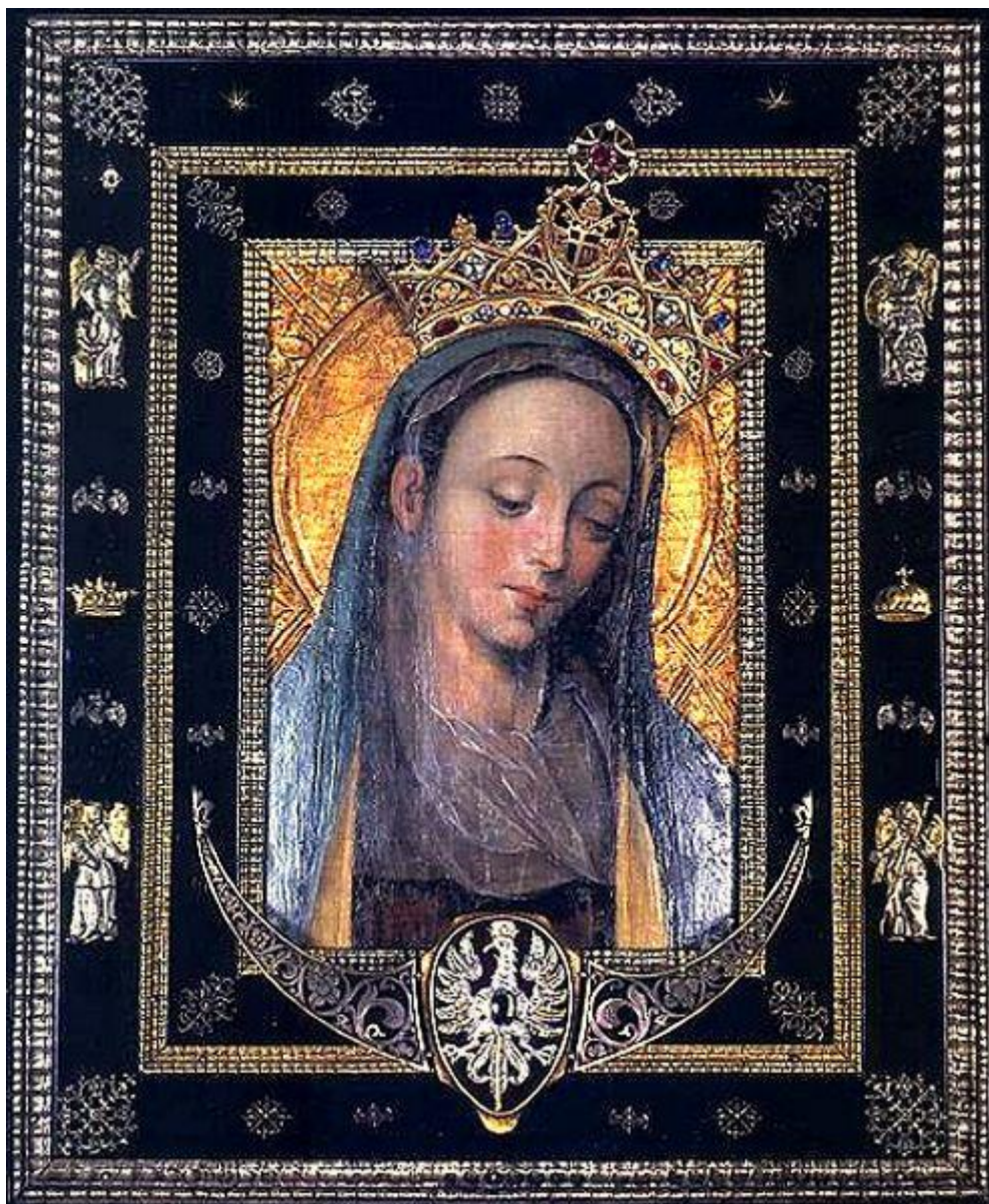
Matka Boża z Rokitna, Królowa Polski

8 września 1717 roku, nastąpiła koronacja koronami papieskimi obrazu Matki Bożej Częstochowskiej jako pierwsza na prawach papieskich poza Rzymem. Sejm z 1764 roku w swoich ustawach nazwał Matkę Bożą Częstochowską Królową Polski.